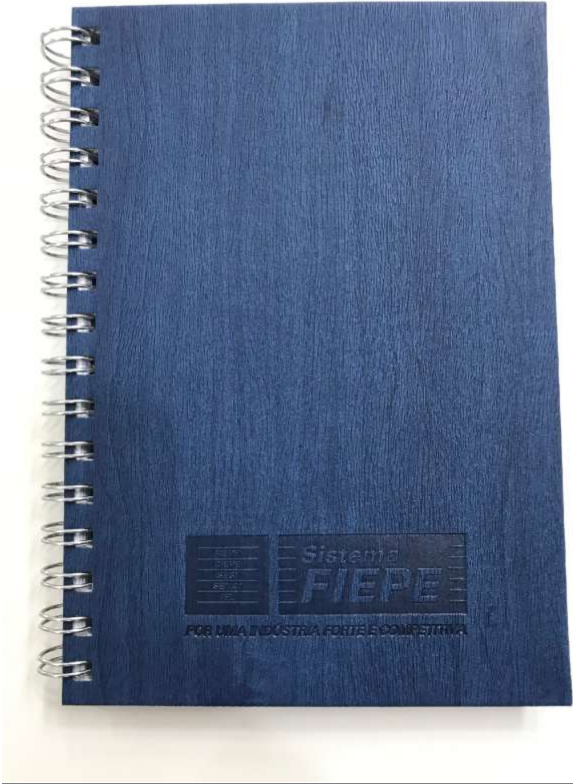
(Modelo da Agenda)